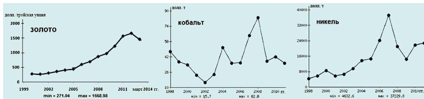
Рис. 2. Динамика изменения цен на золото (дол./тройская унция) в период 1999—2014 гг., кобальт и никель (дол./т) в период 1998—2010 гг.

Стоит отметить, что конъюнктура рынка может подвергать изменению состояние баланса полезных ископаемых, то что сегодня интересно с экономической точки зрения для инвестора, в будущем может не представлять никакого интереса.